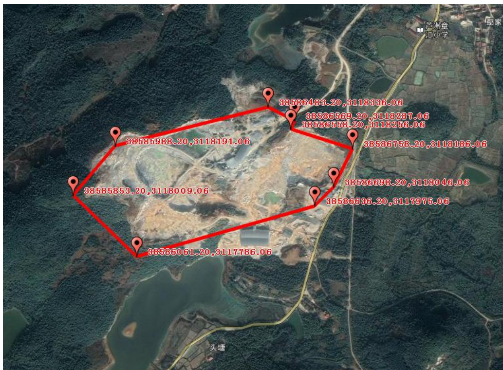
图 1-1 矿区交通位置图